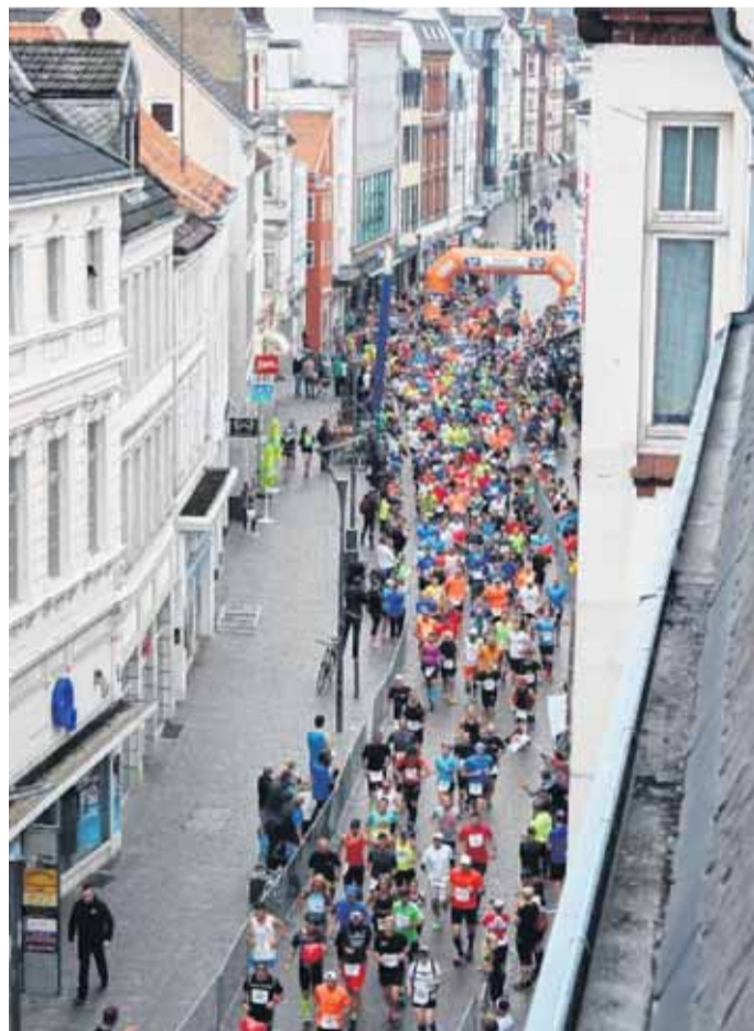
Gemeinsam durch die bezaubernde Kulisse Flensburgs laufen. Dieses Event verbindet Sportler und begeistertes Publikum.

Mehr Musik und Gastronomie an der Strecke wird die Zuschauer erfreuen. Die "Möwe"