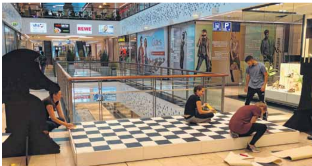
Bei den Vorbereitungen auf die Schachwoche ist das Technik-Team ein ständiger Begleiter.