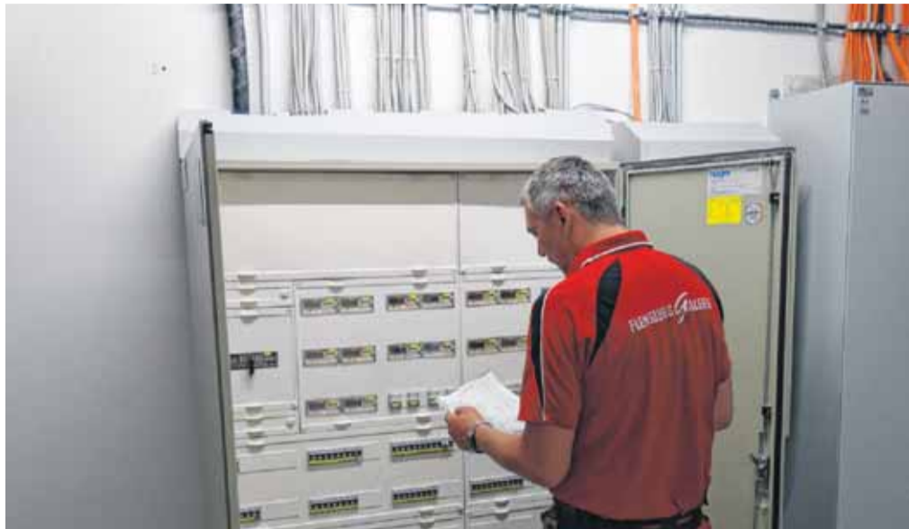
Genauigkeit und ständige Überwachung der gesamten Haustechnik gehört zum Alltag.

Das Aufgabenfeld des technischen Leiters ist vielseitig und bringt täglich neue Herausforderungen