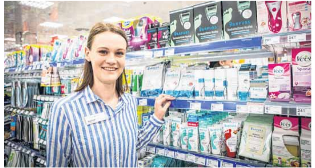
Fußbewusste Verbraucher dürfen im Drogeriefachmarkt Müller von einem umfassenden Sortiment profitieren. Vom Bein bis zum kleinen Zeh: hier ist für jeden gesorgt.

Zeigt her eure Füße – nicht nur das bekannte Kinderlied befasst sich mit den Teilen des Körpers, die uns durch das Leben tragen. Die Kosmetik-Industrie hat schon lange erkannt, dass den Füßen im Alltag viel zu wenig Aufmerksamkeit gewidmet wird.