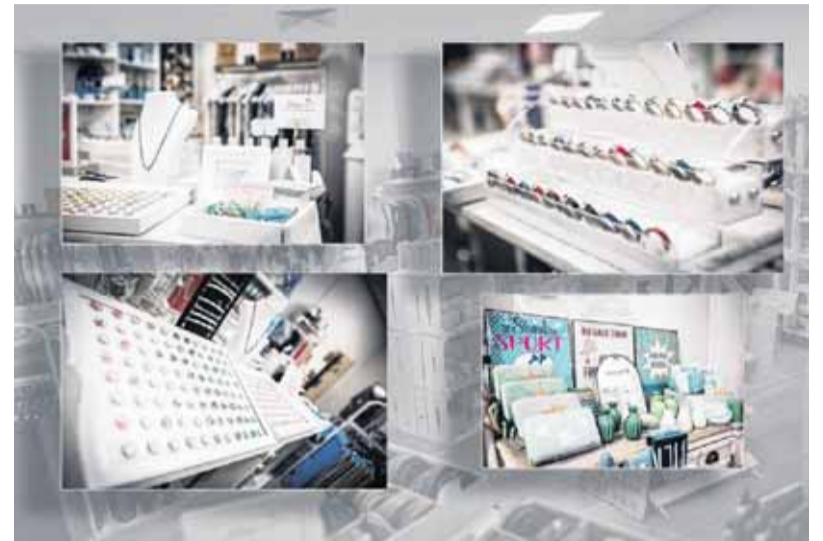
Individueller Schmuck für ein stilsicheres Unterstreichen des eigenen Gefühls.

Cabochons, unter denen sich kleine Malereien, Drucke, Symbole und Zeichen exakt platzieren lassen und damit hervorgehoben werden. Es sind Halbkugeln aus Glas, die in Kombination mit Edelstahl oder Sterling Silber als Kettenanhänger, in Form von Ringen und Armbandverzierungen getragen werden.