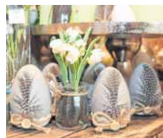
... mit natürlichen Materialien...