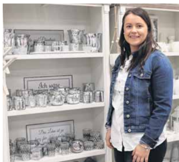
„Bauernsilber“ gibt es bei Lieblingswerke.