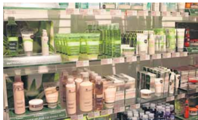
Die Pflanzenkosmetik und Make-up für einen neuen Frühjahrslook findet man bei Yves Rocher.

Umweltaspekte spielen hier eine Rolle. Alle Flaschen sind recycelbar und können wiederverwendet werden. Zudem enthalten die Produkte keine Parabene, Mineralöle und künstliche Duftstoffe.