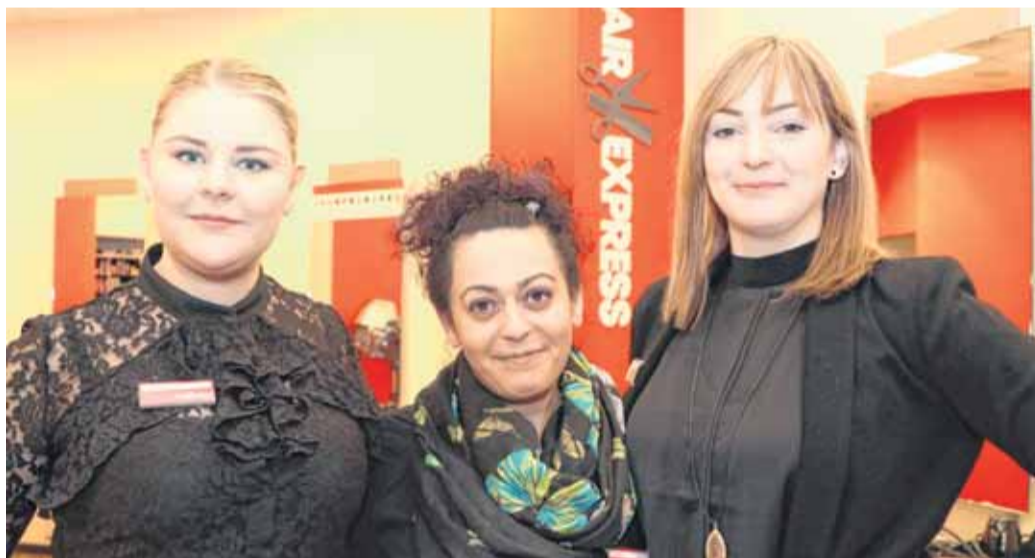
Das Team von Hair Express zaubert den Frühling ins Haar.

Mit den ersten Frühjahrsboten wächst der Wunsch nach einer Frühjahrskur für Haut und Haare. Ein Blick in den Spiegel und der Entschluss ist gefasst: Das Wintergrau muss raus! Hier empfiehlt sich ein Besuch bei Hair Express in der FLENSBURG GALERIE. Spontan, ganz ohne Voranmeldung, kann man sich bei Hair Express frisieren und es sich dabei gut gehen lassen. Kompetent und freundlich bietet das Team nicht nur eine typgerechte Beratung zu Frisur und Haarfarbe, auf Wunsch werden auch Wim-