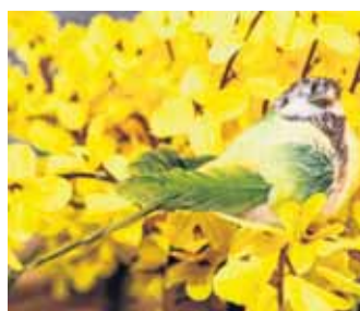
... und als niedliche Vögel.