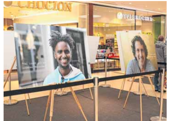
Interessante Eindrücke konnten die Besucher der Galerie beim Anblick der Bilder gewinnen.

Orten ausgestellt. Ein Foto und die große Informations-tafel verbleiben noch in der Galerie. Somit haben die Besucher auch weiterhin die Gelegenheit, sich mit der Thematik zu beschäftigen. Ziel der Projekte der Kinder- und Jugendarbeit ist, allen Kindern und Jugendlichen einen einfachen Zugang zu den Flensburger Jugendzentren zu ermöglichen. Immer wieder werden dabei auch gesellschaftliche Themen aufgegriffen, wie es mit dieser Fotoausstellung der Fall war.