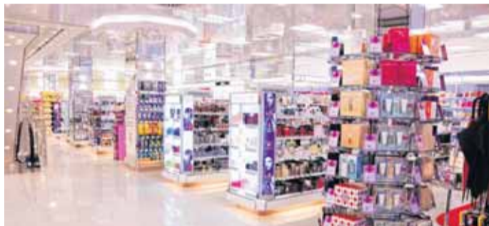
Großzügige Ladengestaltung und ein riesiges Angebot finden die Kunden in der Filiale von Müller.

Ab Donnerstag, 8. März, darf man sich in der FLENSBURG GALERIE über ein neues Einkaufserlebnis