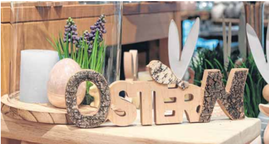
Eine bunte Vielfalt an Osterdekorationen findet man bei NanuNana.

Oder soll es doch lieber wieder der klassische Osterhase sein? Die süßen Mümmelmänner gibt es in vielen Varianten und Ausführungen. Ob aus Holz, Keramik oder Stoff – welchen Stil auch immer man bevorzugt, bei NanuNana in der FLENSBURG GALERIE findet man Osterhasen in unzähligen Varianten. Neu sind die Modelle aus Keramik in zarten Pastelltönen mit Perlmuttglanz. Ein anderes Motiv erobert die Osterwelt: Vögel. Die klassischen Frühlingsboten finden sich nicht nur auf Ostereiern aus Porzellan, wie sie zum Beispiel Sinnerup anbietet, wieder. Auch als naturgetreue Nachbildungen (gesehen bei NanuNana) verzaubern sie je-