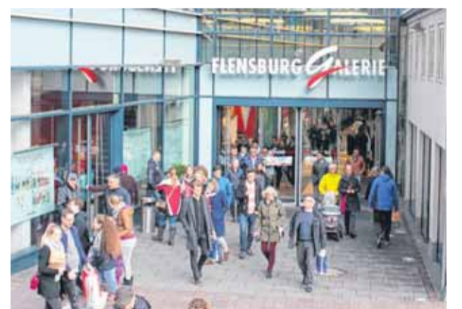
Die Shops in der FLENSBURG GALERIE laden zum stressfreien Sonntageinkauf ein.

D en 4. März sollte man sich unbedingt in den Terminkalender eintragen: An diesem Sonntag startet die Serie der verkaufsoffenen Sonntage. Gerade rechtzeitig, um sich auf das kommende Osterfest einzustimmen oder nach der neuen Frühjahrsmode