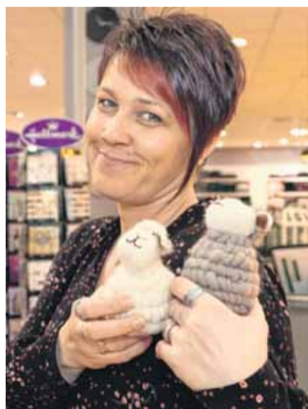
Diese niedlichen Osterschäfchen gibt es bei Sinnerup.

den Osterstrauß und sind auch über das Osterfest hinaus eine sehr nette Dekoration. Dass Ostereier ein traditioneller Oster schmuck sind, ist bekannt. Doch was sich bei NanuNana an Varianten findet, ist schon bemerkenswert. Hier reicht die Bandbreite von witzig über originell bis zu klassisch. Nach wie vor sind auch Dekoartikel aus Naturmaterialien, wie zum Beispiel Holz und Federn, gefragt. Wer noch keine Idee hat, wie die Osterdekoration dieses Jahr aussehen soll, der kann sich in den Shops der FLENSBURG GALERIE inspirieren lassen.