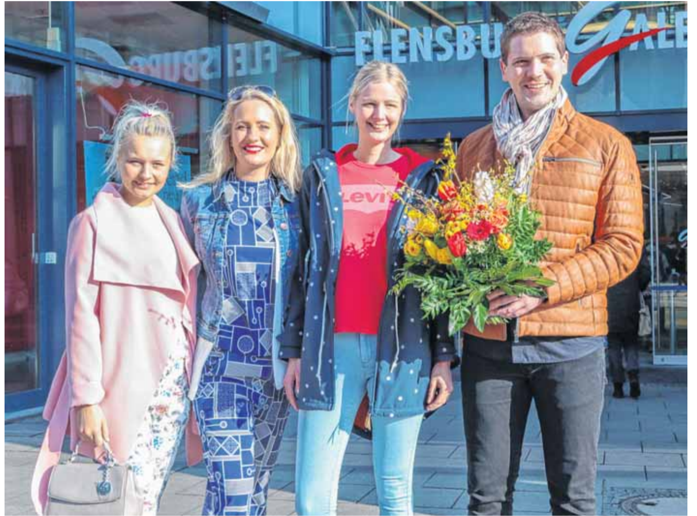
Die Shops in der FLENSBURG GALERIE laden zum entspannten Frühjahrs-Shopping in angenehmer Atmosphäre ein.

Die Frühlingsboten sind unübersehbar. Mit den ersten Sonnenstrahlen erhellen sich auch die Gesichter der Menschen, die Laune steigt und der Wunsch nach frischen Farben und neuer Mode wächst. Raus aus den Wintersachen. Ade Schal, Mütze und Handschuhe! Jetzt wird voller Vorfreude durch die Kollektionen der Lieblingsshops gestöbert. In der FLENSBURG GALERIE hat der Modedefrühling bereits Einzug gehalten. Die Farbpalette der Mode reicht von kräftigen Rottönen über unterschiedliche Blautöne bis hin zum kräftigen Gelb. Aber auch Pastelltöne sind nach wie vor angesagt. Die Frühjahrsmode zeigt sich diese Saison wieder als eine Kombination aus Unifarben, floralen Drucken und Streifen. Aufgepeppt wird das Outfit mit den schicksten Modellen der Schuhmode, die mit Perlmutterglanz, Glitzer, Samt und auch etwas Plüsch punkten. Auch bei den Dekoartikeln ziehen sich die Farbtrends durch.