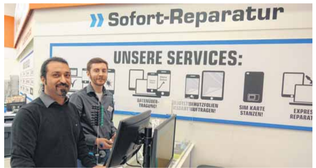
Die Techniker vom Sofort-Reparaturservice bei Saturn sind den ganzen Tag im Einsatz.

„Wir kümmern uns neben Smartphones auch um Tablets, Notebooks, PCs und Navigationsgeräte. Grundsätzlich bieten wir unseren Kunden für alle im Alltag benötigten Kommunikationsgeräte