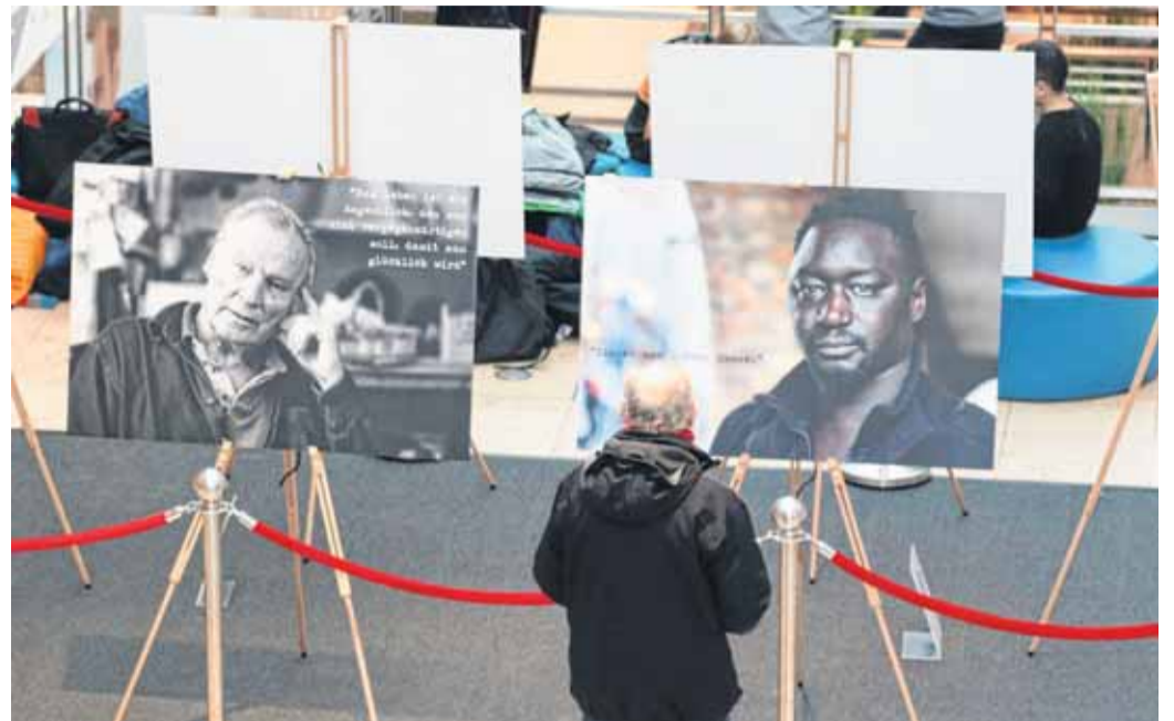
Die Fotos von Peter Kröber zeigen Menschen mit unterschiedlichen Wurzeln und Geschichten.

Großen Anklang fand die Fotoausstellung „Ich lebe hier“. Vom 10. bis zum 19. Februar konnten die Besucher der FLENSBURG GALERIE die Bilder des Fotografen Peter Kröber besichtigen. Über 90000 Besucher hatten in dieser Woche Gelegenheit dazu. Ein großer Erfolg für den Arbeitskreis „Jugendarbeit für alle“ und die Mitarbeiter aus der Flensburger Kinder- und Jugendarbeit, die diese Aktion ins Leben gerufen haben, und auch für die FLENSBURG GALERIE, die sich für diese Idee begeistern ließ und die Ausstellungsfläche zur Verfügung stellte. Bei dieser Ausstellung ging es um Verschiedenheit, Gleichheit und Normalität. Die Besucher hatten in der Galerie die Möglichkeit, sich beim Betrachten der Portraits mit diesem Thema auseinanderzusetzen. In den einzelnen Aussagen wurde deutlich, dass die 20 abgebildeten Persönlichkeiten, so verschieden ihre Lebensläufe auch sind, im Grunde dieselben Sehnsüchte, Wünsche und Hoffnungen haben. „Verschiedensein ist normal und nicht erschreckend anders“, ist die Aussage dieser Fotoausstellung. Die Bilder werden noch bis zum 16.03. an verschiedenen