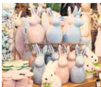
Osterdeko in Pastelltönen...