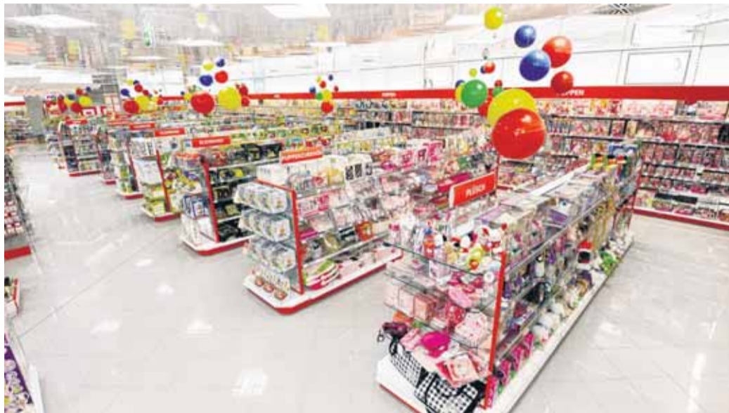
Gut sortiert, mit großem Sortiment bietet Müller den Kunden einen Erlebniseinkauf.

Ab Donnerstag, 8. März, darf man sich in der FLENSBURG GALERIE über ein neues Einkaufserlebnis